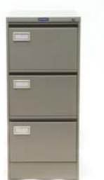
Filing Cabinet 3 laci* Ref. No. FC3D... Dimensi: 103,7(T) x 45,7(L) x 62(D) cm Berat = 39,5 kg