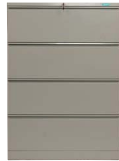
Filing Cabinet Lateral 4 laci Ref. No. FCL4... Dimensi: 140(T) x 92(L) x 48(D) cm Berat = 80 kg