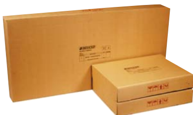
Completely Knock Down