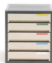
Datatrays 5 laci tertutup Ref. No. CD311 Dimensi: 33,4(T) x 29,8(L) x 35,8(D) cm