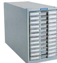
Cardex 12 laci Ref. No. CX12 Dimensi: 42(T) x 26,8(L) x 61(D) cm Berat = 48,5 kg