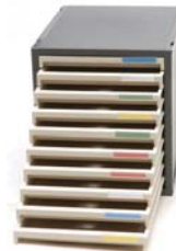
Datatrays 10 laci tertutup Ref. No. CD111 Dimensi: 33,4(T) x 29,8(L) x 35,8(D) cm